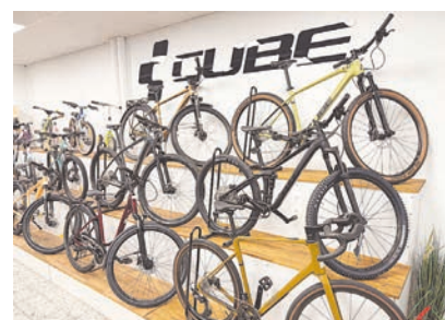
Seit drei Jahrzehnten führt das Radhaus Viernheim die Marke Cube – ob Citybike, E-Bike, Rennrad oder Mountainbike.

Einfach einmal vorbeischaun in der Rathausstraße 56 und sich von der großen Auswahl, der Beratung und dem speziellen Service überzeugen lassen oder einfach anrufen unter Tel. 06204-3953.