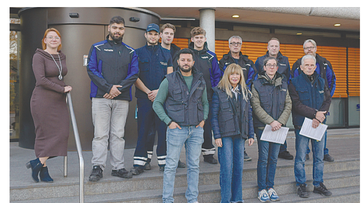
Mit der jährlichen Erfassung leisten die Stadtwerke einen wesentlichen Beitrag zu einer zuverlässigen Energie- und Wasserversorgung. Eine sorgfältige und termingerechte Ablesung ermöglicht nicht nur eine transparente Abrechnung, sondern unterstützt zudem die langfristige Planungssicherheit für Haushalte, Gewerbe und kommunale Einrichtungen.