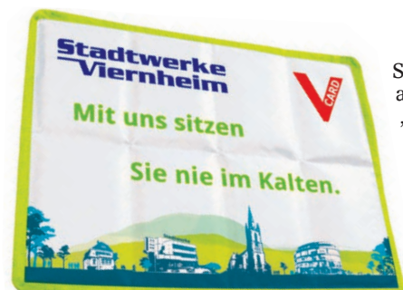
Das Treuepräsent 2026 für die Energiekunden der Stadtwerke Viernheim: Ein handliches schickes und kälteabweisendes Sitzkissen samt Schutzbeutel.