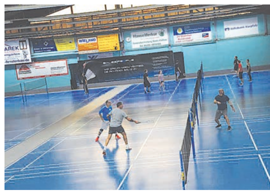
Herzstück der „Badminton Oase“ in Hemsbach sind die 13 Plätze mit punktelastischem, gelenkschonendem Spezialboden. Die gemütliche „GIGAMOT Sportsbar“ wurde neu gestaltet.

Den Platz zum Badminton-Spielen bitte zuvor telefonisch buchen unter Tel. 06201 - 434 80. Alle weiteren Infos findet man auf www.badminton.oase.de .