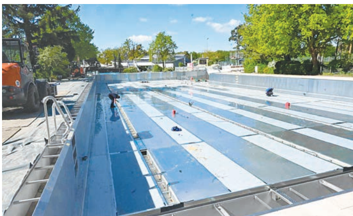
Das große Schwimmerbecken mit den 50 Meterbahnen wurde komplett erneuert und steht den Badegästen ab dieser Saison zur Verfügung. Die Edelstahlplatten sind mittlerweile zu 100 Prozent verschweißt. Die letzten Bauarbeiten sind im Plan, sodass die Saisonöffnung am Pfingstsonntag fest eingeplant ist.

Reiseteam Weltweit. Rathausstraße 26. 68519 Viernheim. Sonnenklar TV Buchungsstelle. Telefon 06204-77701. Homepage: www.flug.com . www.facebook.com/ReiseteamWeltweit . E-Mail: reiseteam-weltweit@web.de .