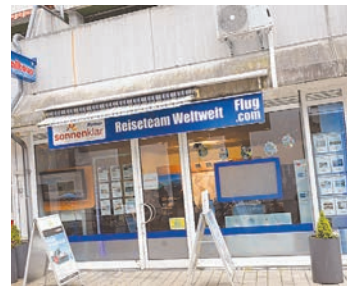
Das bekannte Reisebüro „Reiseteam Weltweit“ von Volker Reinhardt ist in der Schulstraße (Rathausstraße 26) beheimatet.

Das Nichtschwimmerbecken mit der Riesenrutsche wurde letztes Jahr rundum saniert. Besonders beliebt bei den kleinen Badegästen ist das Planschbecken mit dem großen Sonnensegel.