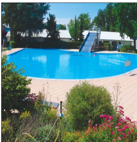
Das Waldschwimmbad, inmitten vieler Blumen und Bäume, bietet trotz der Corona-Einschränkungen viel Entspannung und Erholung. Auf der Liegewiese kann Sonne satt getankt werden.

geöffneten baulichen Einrichtungen. Im Bereich des Eingangs, der Umkleiden, der Schrankflächen und der Toiletten ist Mund- und Nasenschutz zu tragen. Die Beckenumgänge sind freizuhalten. Für das Sonnenbaden stehen die Wiesenbereiche zur Verfügung. Zur Vermeidung von Ansteckungen sind die ausgehängten Verhaltensregeln einzuhalten. Anweisungen des Bädersonnens zum Gesundheitsschutz ist Folge zu leisten.